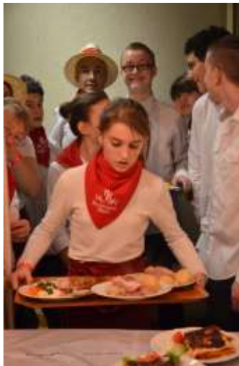
Jeunes bénévoles à la restauration

Un espace restauration rapide permettra au public plus pressé de satisfaire à ses envies.